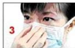
3 Fixați partea metalică a măștii cât mai bine pe nas