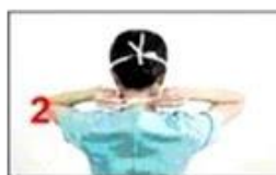
2 Legăți snurul de jos la baza gâtului