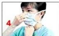
4 Asigurați-vă ca masca vă acoperă nasul, gura și bărbia, și că este fixa pe față