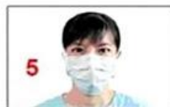
5 Schimbați masca la fiecare 4 ore sau dacă devine umedă sau defectă