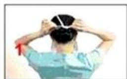
1 Legăți snurul de sus în partea superioară a capului